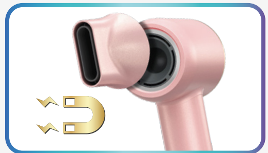
Magnetischer Aufsatz. Einfacher Wechsel und hohe Kontrolle beim Styling