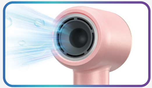
Plasma-Technologie – bis zu 500 Mio. Ionen Reduziert Frizz und statische Aufladung der Haare