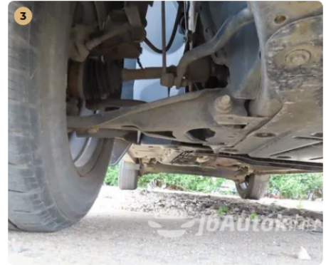
✓ Száraz féltengelyek