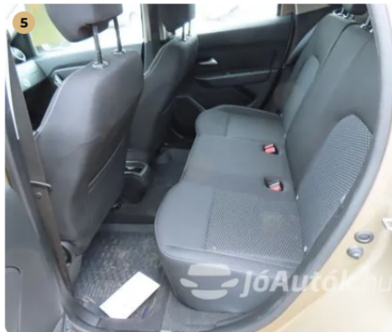
✓ szép belső tér