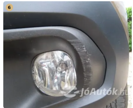
! első lökhárítón karcolás