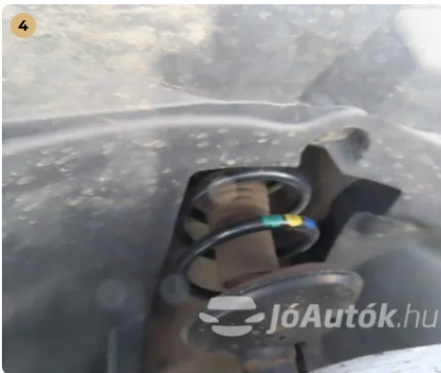
✓ száraz lengés csillapítók