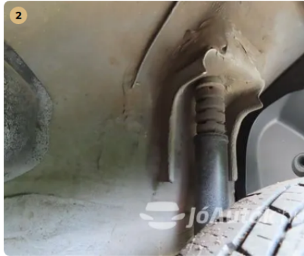
✓ száraz lengés csillapítók