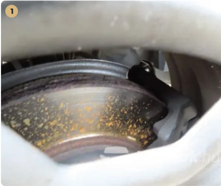
! féktárcsának minimális válla van