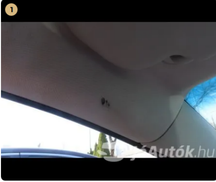
⚠ bal első A oszlop belső kárpit ki van égetve