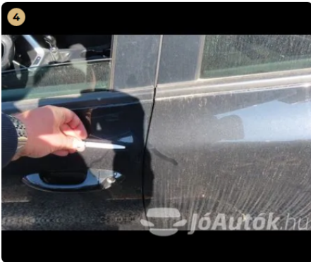
⚠ bal első és bal hátsó ajtó