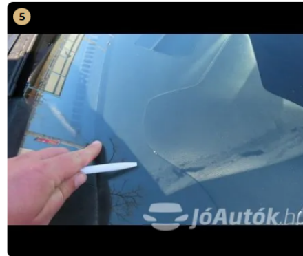
⚠ első szélvédő