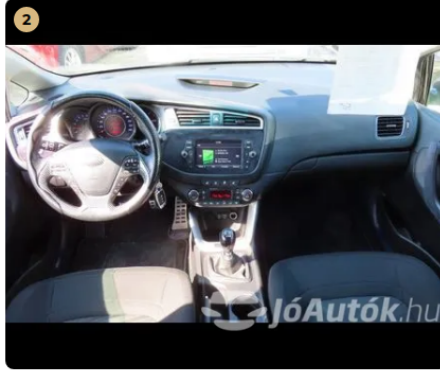
✓ belső kárpitozás korához képest igényesen úja lettek kárpitozva a belső disz lécek, közép konzol, ajtó kárpitok