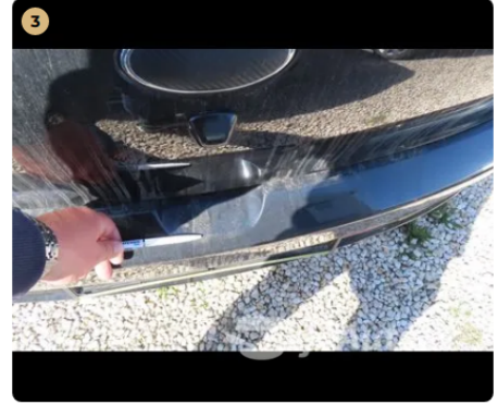
⚠ hátsó vészháritó enyhe karcolások