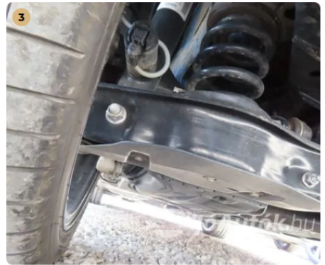
✓ Futómű A lengéscsillapítón olajfolyás nem észlelhető. -