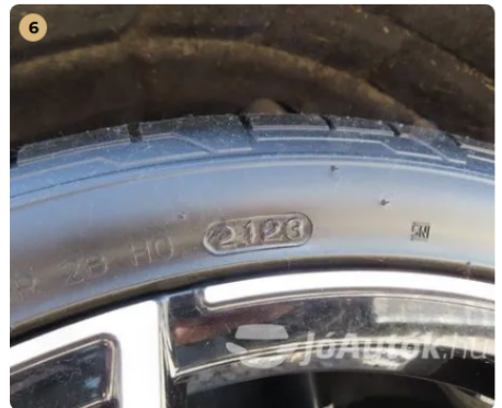
✓ Gumiabroncsok A gumiabroncsok odalfala nem repedett. -