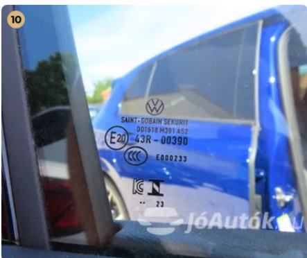
✓ Szélvédők, üvegek Oldalsó üvegen látható sérülés nincs. -