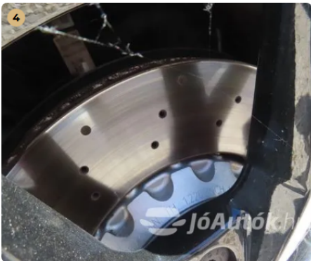
✓ Fékkrendszer A féktárcsa új. -