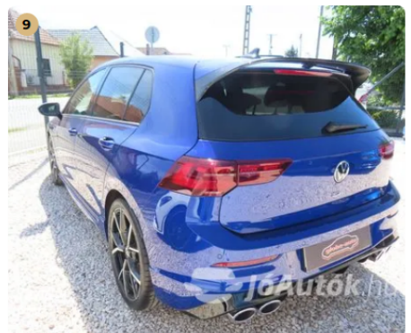
✓ Külső karosszéria elemek A karosszéria elemek közötti hézagok megfelelőek. -