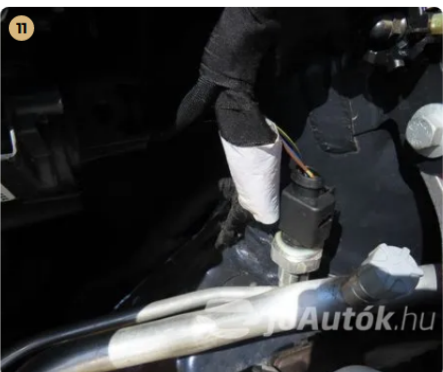
✓ Utascella és gyűrődő zónák A nyúlványokon külsérelmi nyomok nem