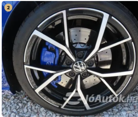
✓ Felnik Könnyűfém felni gyári. -