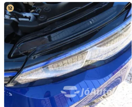
✓ Világítás Az első fényszórók nem sérültek. -