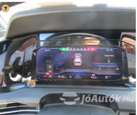
✓ Hibakód kiolvasása Az autó beindítását követően kontrollámpa a műszerfalán nem világít. -