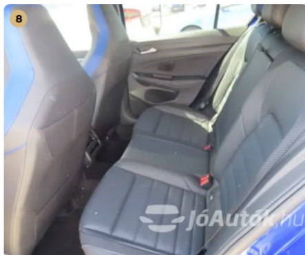
✓ Kárpitozás és belső burkolatok A bőr/alcantara kifogástalan állapotú. -