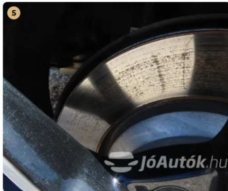
✓ Fékkrendszer A féktárcsa új. -