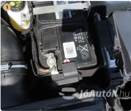
✓ Elektromos berendezések Akkumulátor gyári. -