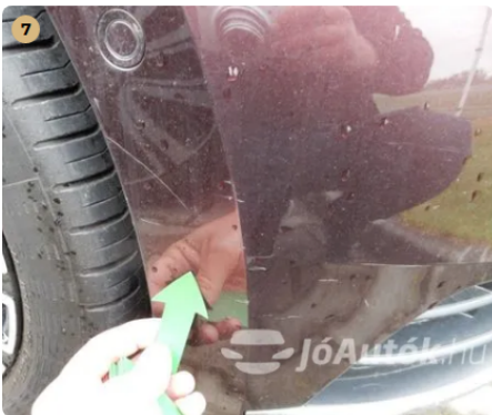
⚠ Karc az első lökhárítón