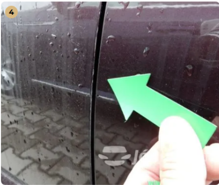
⚠ Kopás a bal első ajtóperemen