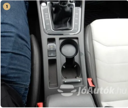
⚠ Foltok a középkonzolon