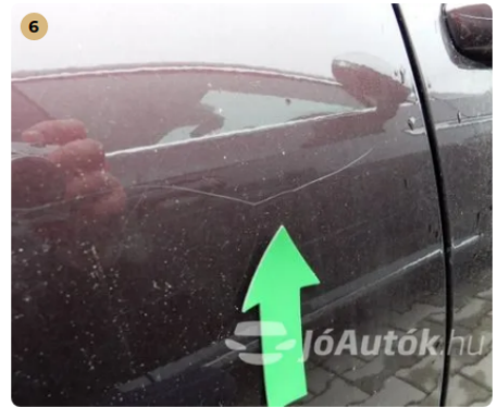
⚠ Karc a bal hátsó ajtón