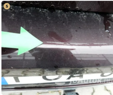
⚠ Karc a csomagterájtón