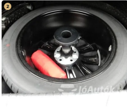
✅ Teljes értékű pótkerék