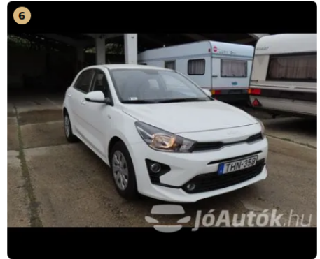
✓ jármű fényezése