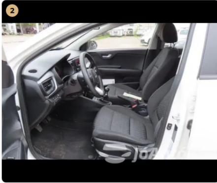
✓ belső kárpitozás megkímélt állapotú, újszerű