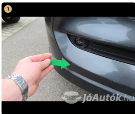
⚠ első vészháritó apró kavics sérülések