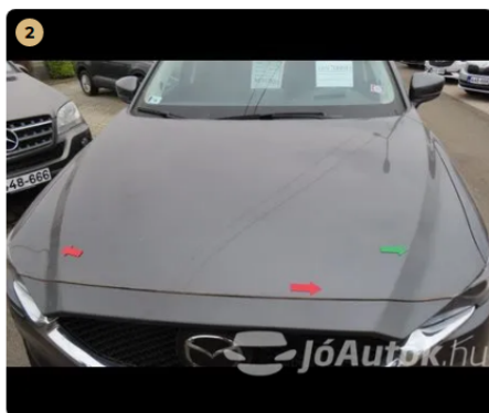
⚠ motorháztető kavics sérülések