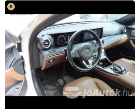
✓ Kárpitozás és belső burkolatok Műszerfal újszerű állapotú. -