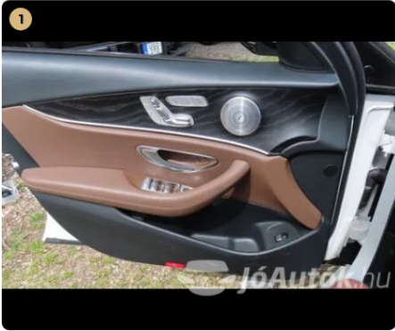
✓ Elektromos berendezések Gombvilágítások megfelelően működnek. -