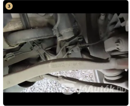
✓ Futómű Szélső rúdfejen kopást, sérülést nem találtam. -