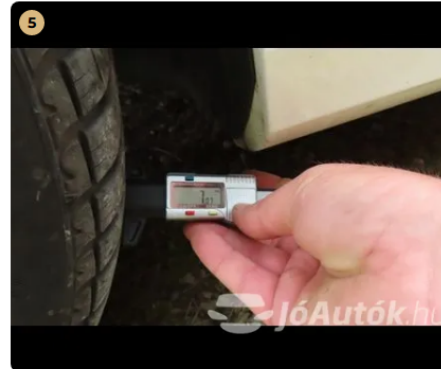
✓ Gumiabroncsok Egyéb újszerű állapotban vannak