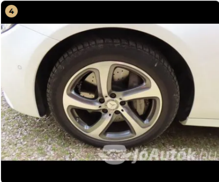
✓ Féktárszer A féktárcsa megfelelő állapotban van. -