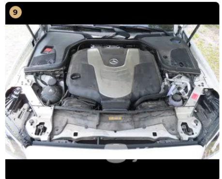
✓ Utascella és gyűrődő zónák A nyúlványokon külsérelmi nyomok nem találhatóak. -