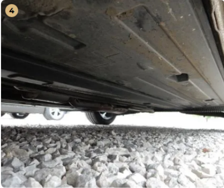
✓ Külső karosszéria elemek