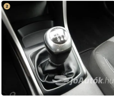
⚠ Kárpitozás és belső burkolatok