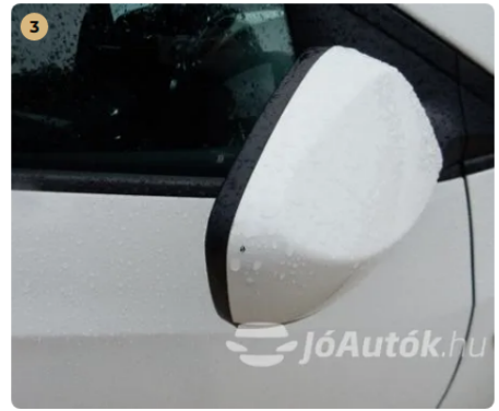
⚠ Külső karosszéria elemek