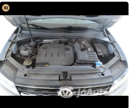
✓ Utascella és gyűrődő zónák A nyúlványokon javításra utaló nyomok nem észlelhetőek. -