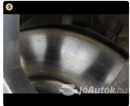
✓ Fékrendszer A féktárcsa megfelelő állapotban van. -