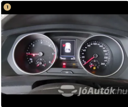
✓ Elektromos berendezések Műszerfalenyek megfelelően működnek. -