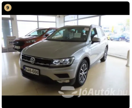
✓ Külső karosszéria elemek A karosszéria elemek közötti hézagok megfelelőek. -