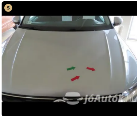
⚠ Külső karosszéria elemek Az autó használatából eredő apró kavicsfelverődések, hajszaál karcok láthatóak. jobb első sárvédőn és a motorháztetőn kavics sérülések találhatóak