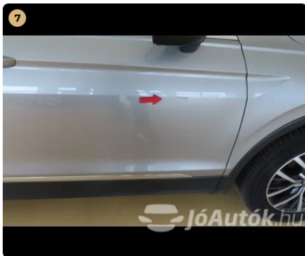
⚠ Külső karosszéria elemek Egyéb horzsolt