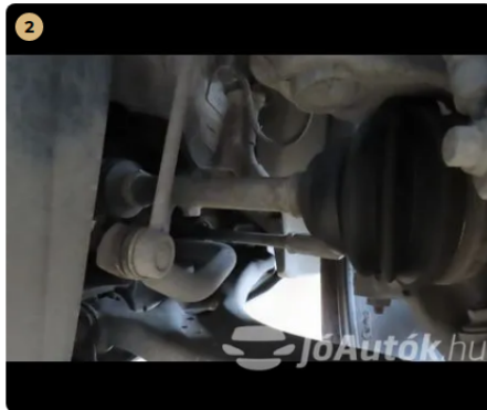
✓ Futómű A féltengelyen zsíros / olajos kicsapódás nem látható. -