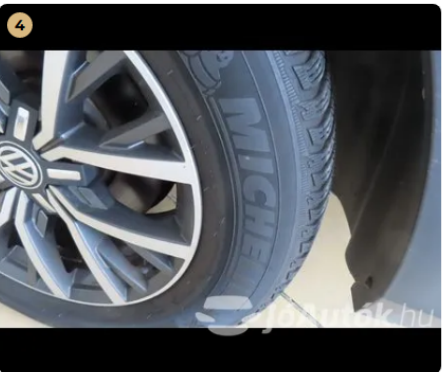
✓ Gumiabroncsok A gumi oldalfalán, szálszakadás jele (dudor) nem található. gumiabroncsok enyhén ki vannak repedezve, de még cserére nem ajánlott