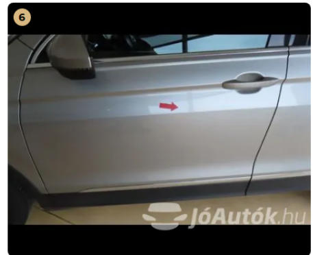
⚠ Külső karosszéria elemek Egyéb horpadás