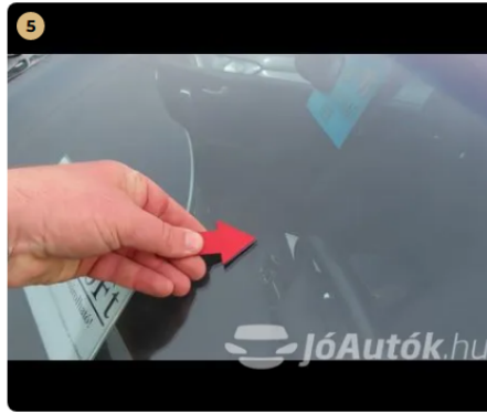
! első szélvédő kavics sérülés