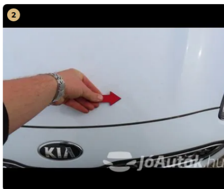
⚠ motorháztető kavics sérülés