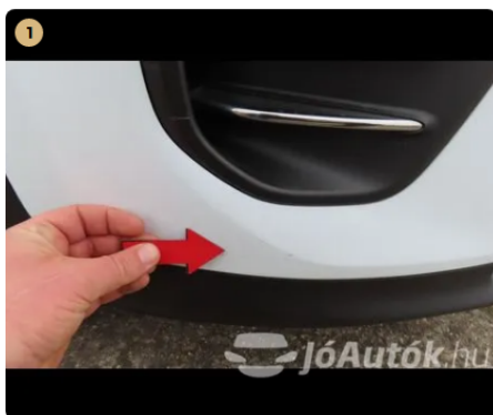
⚠ első vészháritó apró kavics sérülések