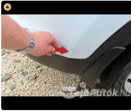
! hátsó vészharító fény sérülés, karc