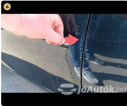
! bal első ajtó fénysérülés