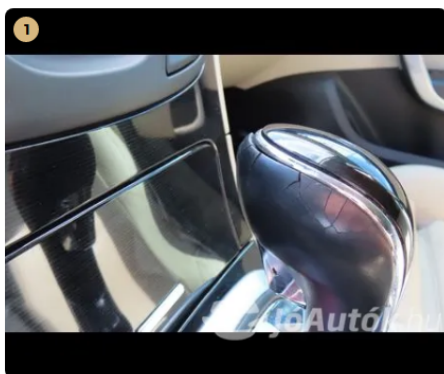
váltógomb repedezett, kopott