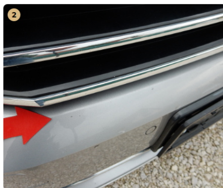
2 első lökhárító