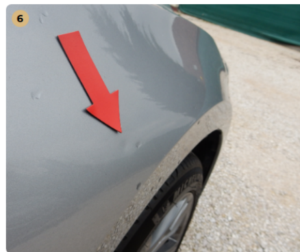
! jobb első sárvédő