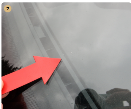
! első szélvédő