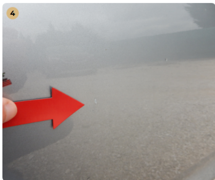
! jobb első ajtó