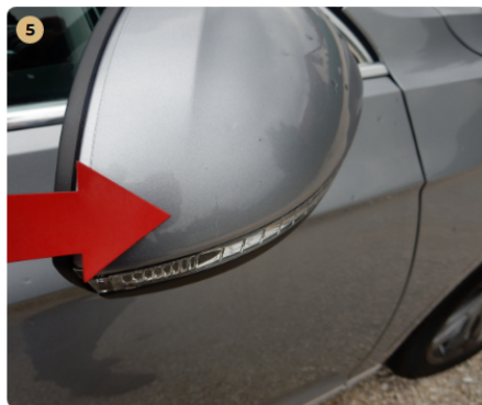
! jobb első ajtó