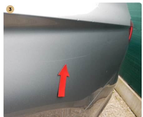
3 bal hátsó sárvédő