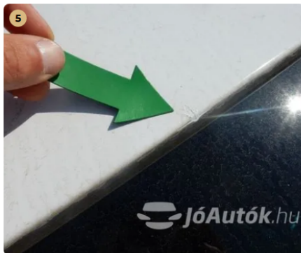
! Kavicsnyom a tető és a szélvédő peremén