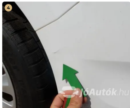
! Apró sérülés a hátsó lökhárítón