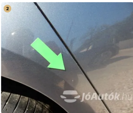
⚠ Kisebb karc a jobb hátsó sárvédőn