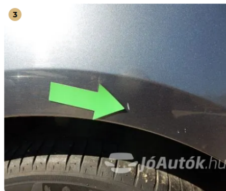
⚠ Kisebb karc a jobb hátsó sárvédőn