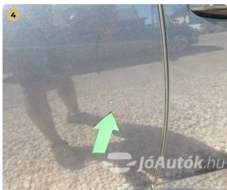
⚠ Kisebb karc a jobb hátsó ajtón