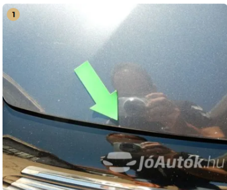
⚠ Kavicsnyomok a motorháztetőn