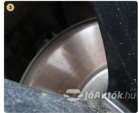
✓ Fékrendszer A féktárcsa megfelelő állapotban van. -