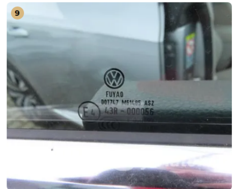
✓ Szélvédők, üvegek Az első szélvédőn látható sérülés nincs. -