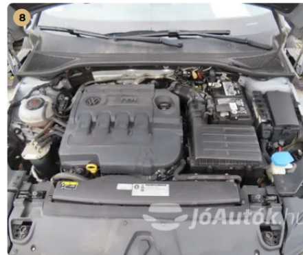
✓ Motor Motortérben olajfolyás nem látható. -