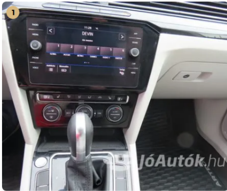
✓ Elektromos berendezések Gombvilágítások megfelelően működnek. -