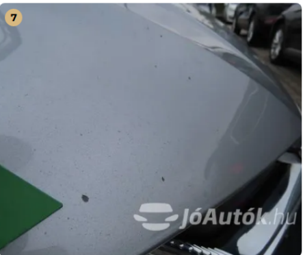
⚠ Külső karosszéria elemek Az autó használatából eredő apró kavicsfelverődések, hajszal karcok láthatóak. -