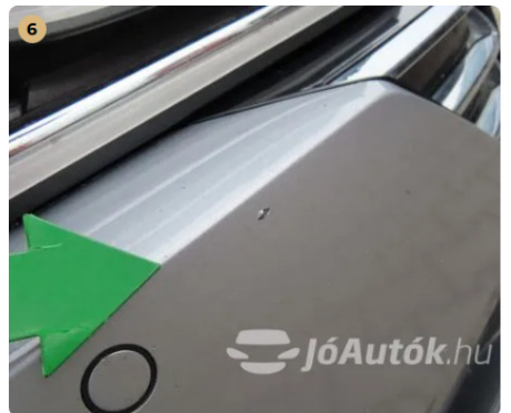
⚠ Külső karosszéria elemek Az autó használatából eredő apró kavicsfelverődések, hajszal karcok láthatóak. -