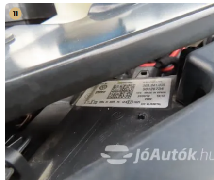
✓ Világítás Az első fényszórók nincsenek bemattulva. -