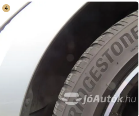
✓ Gumiabroncsok A gumi oldalán, szálszakadás jele (dudor) nem található. -