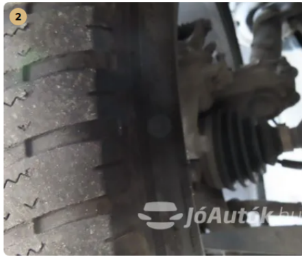
✓ Futómű A lengéscsillapítón olajfolyás nem észlelhető. -