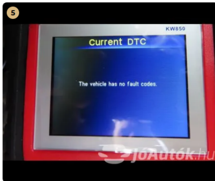
✓ Hibakód kiolvasása Számítógépes kiolvasás során nem találtam hibát. -