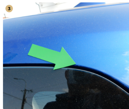
⚠ bal hátsó sárvédő