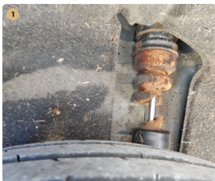
⚠ jobb hátsó lökésgátló