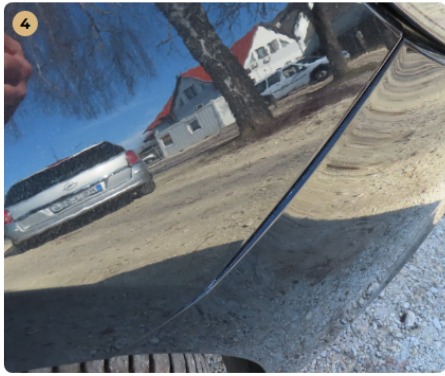
! jobb első sárvédő apró fény sérülés