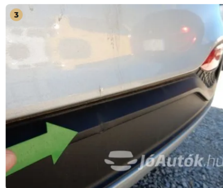
⚠️ Kisebb sérülés a hátsó lökhárítón Kisebb sérülés a hátsó lökhárítón