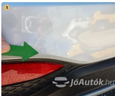
⚠️ Apró sérülés nyoma a hátsó lökhárítón Apró sérülés nyoma a hátsó lökhárítón