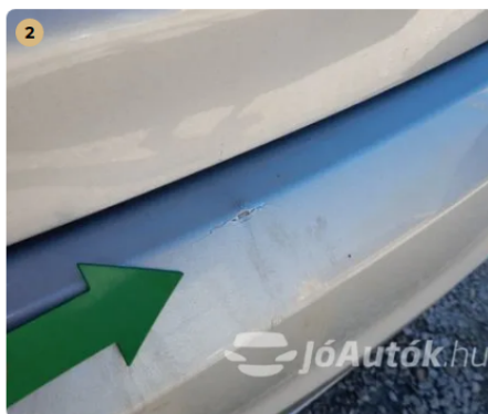
⚠️ Kisebb sérülés a hátsó lökhárítón Kisebb sérülés a hátsó lökhárítón