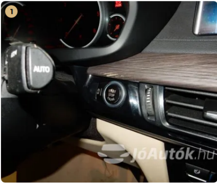
⚠ Kopás az indító gombon