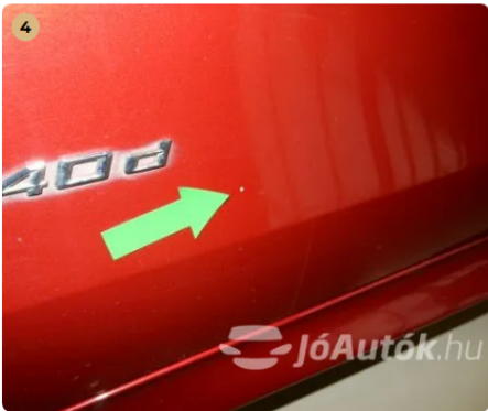
⚠ Kavicsnyom a bal oldali ajtón