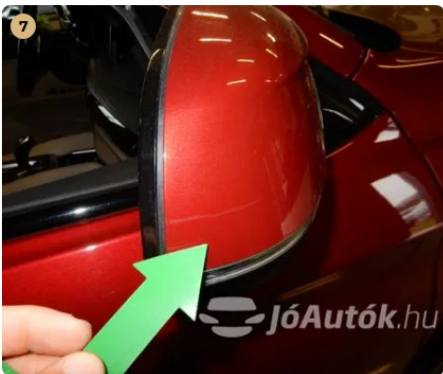
⚠ Karc a jobb első tükrön