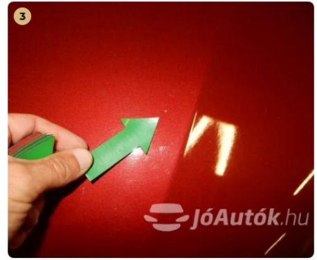
⚠ Kavicsnyom a motorháztetőn