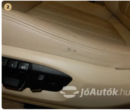
⚠ Kisebb kopás a sofőrülésen