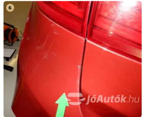
⚠ Apró sérülés a hátsó lökhárítón