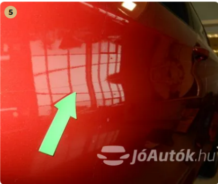
⚠ Hosszabb de polírozható karc a bal első és hátsó ajtón