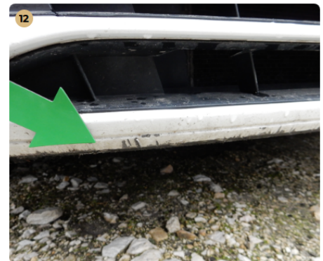
12 első lökhárító