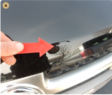
4 bal első ajtókárpit