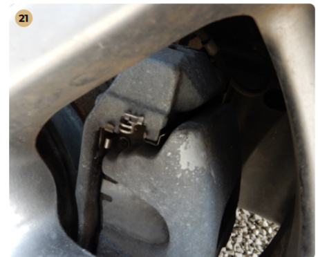
21 jobb első ajtó