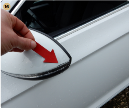
16 bal első ajtó