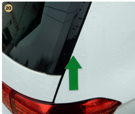
20 jobb hátsó sárvédő