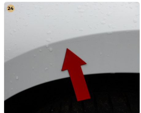
24 jobb első sárvédő