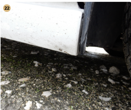
22 jobb oldali küszöb