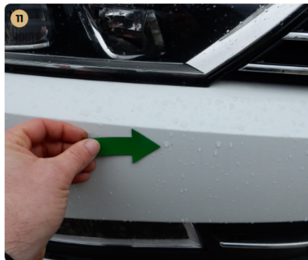
11 első lökhárító