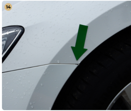
14 első lökhárító