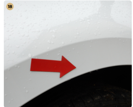
18 bal hátsó sárvédő