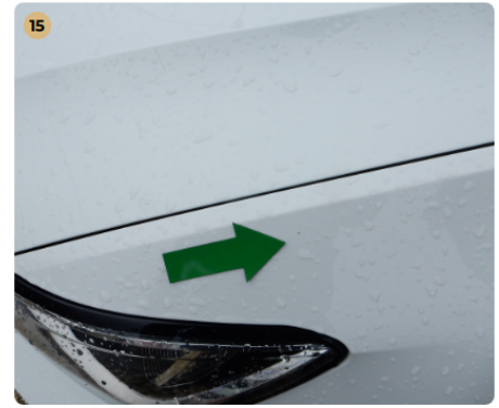
15 bal első sárvédő