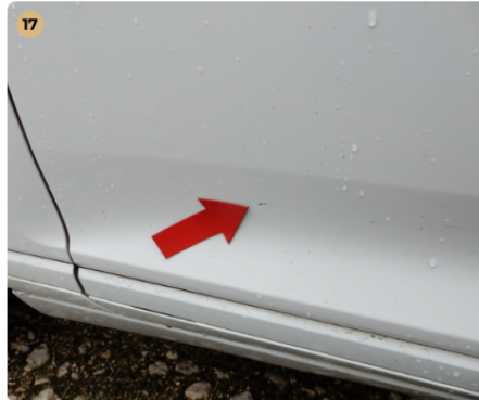
17 bal első ajtó