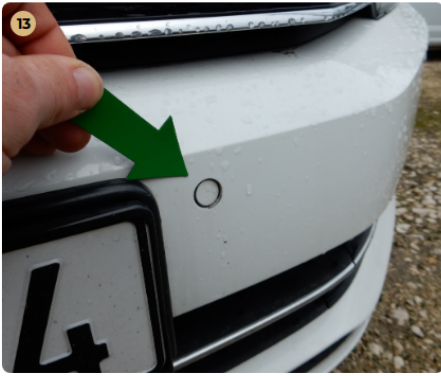
13 első lökhárító