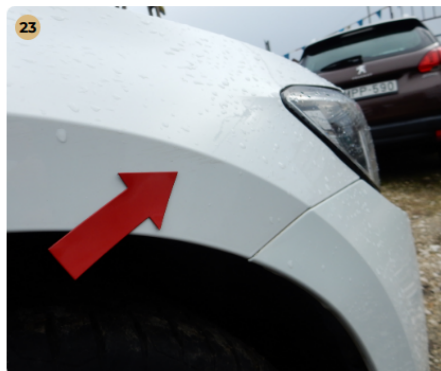
23 jobb első sárvédő