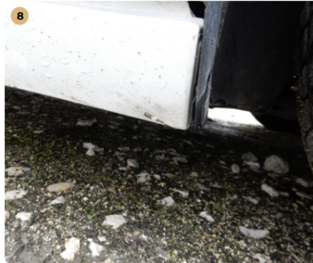
8 bal oldali küszöb