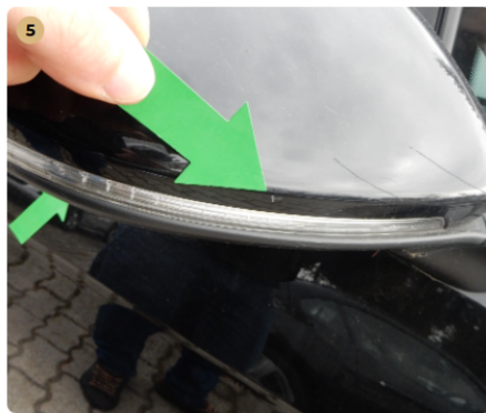
❗ jobb első ajtó