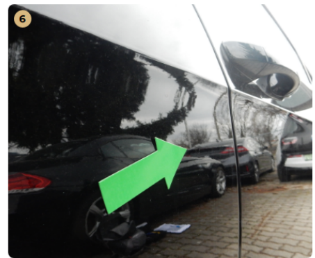
❗ jobb hátsó sárvédő