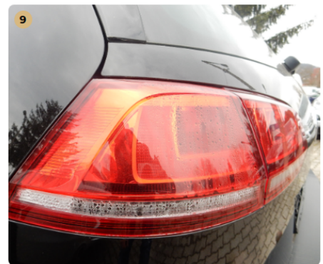
❗ bal hátsó lámpa