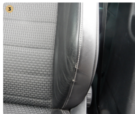
⚠ bal első üléskárpit