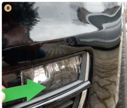
❗ első ködlámpák