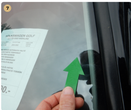
❗ első szélvédő