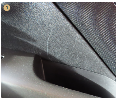
⚠ jobb első ajtókárpit