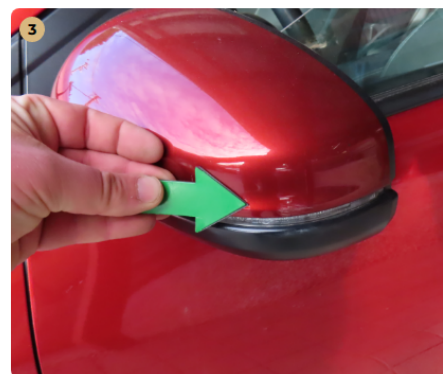
⚠ bal első ajtó

visszapillantó tükör burkolat enyhén horzsolt