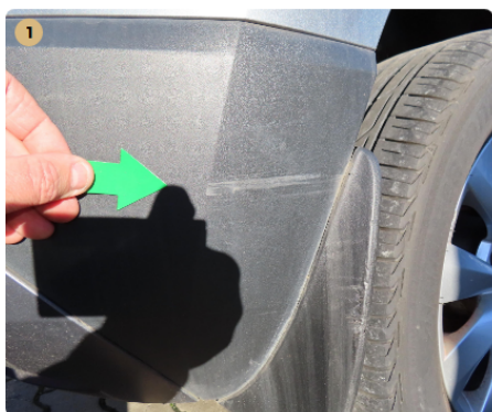
⚠ hátsó lökhárító