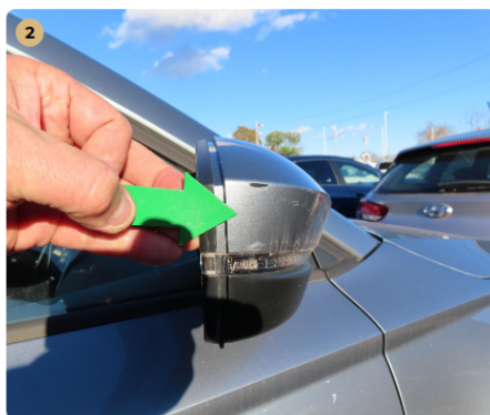
⚠ Jobb Tükör