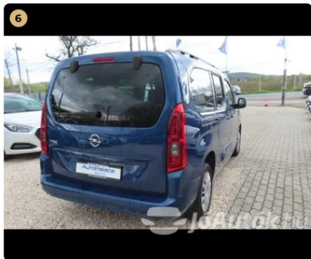
✓ hátsó szélvédők színezett üveg