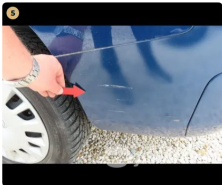
! hátsó vészfékítő horzsolás