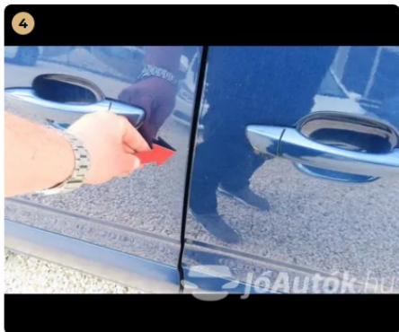
! bal oldali toló ajtó fény sérülés