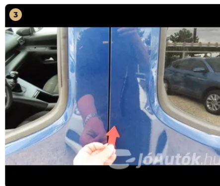
3 bal oldali toló ajtó karc