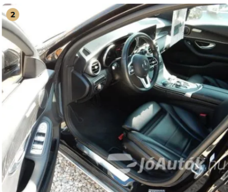
✓ Szép megkímélt beltér