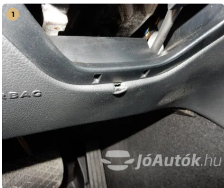
⚠ Apró sérülés a kormány alatti részen