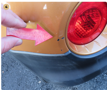
! hátsó lökhárító horzsolt, fény sérült