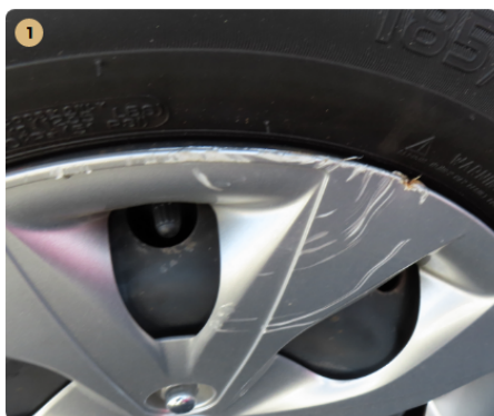
! bal hátsó felni dísztárcsa horzsolt