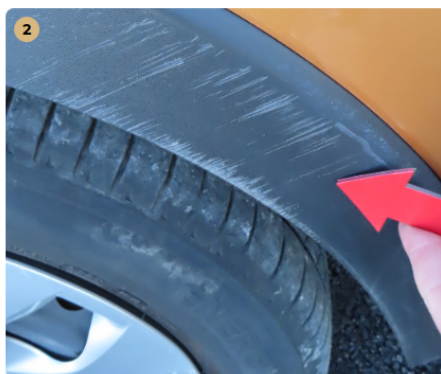
! első lökhárító horzsolt, fénysérült