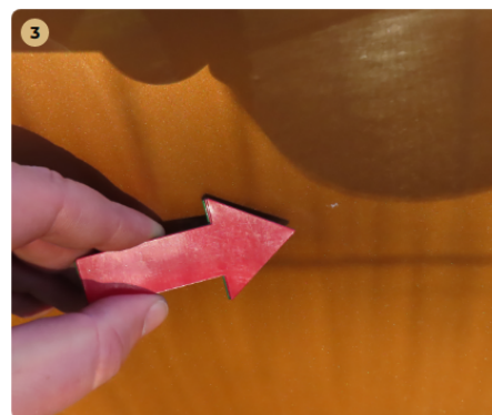
! bal első ajtó karc