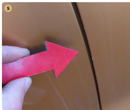
! jobb első ajtó fény sérülés