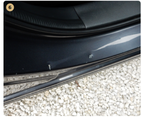
6 jobb oldali küszöb Horpadás