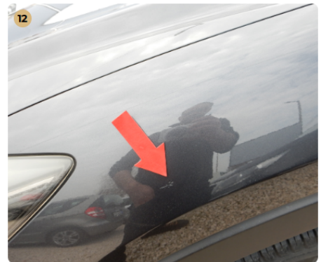
12 bal első sárvédő Karcolás