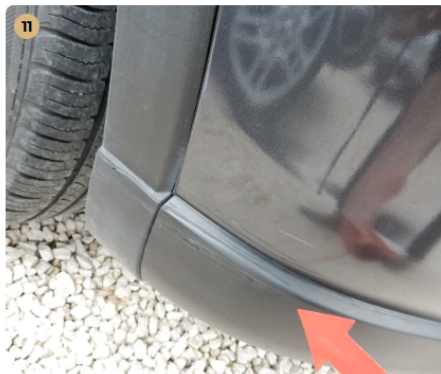
11 első lökhárító Horzsolás