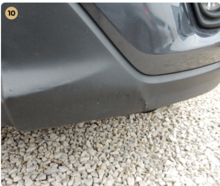
10 első lökhárító Apró sérülés