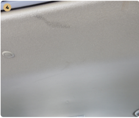
4 tetőkárpit Szennyezett