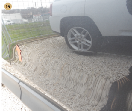
! jobb első ajtó Karcolás