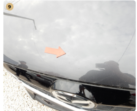
9 motorháztető Kavicsnyomok