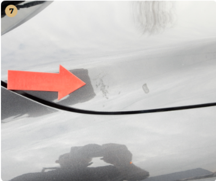
7 motorháztető Karcolások