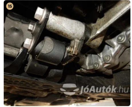
! Olajszivárgás nyomai Olajszivárgás nyomai láthatóak az autó alján