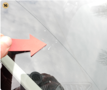
! első szélvédő Kavicsnyom