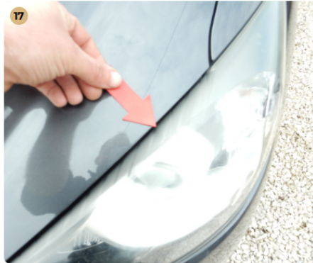
! bal első fényszóró Kismértékű mattulás