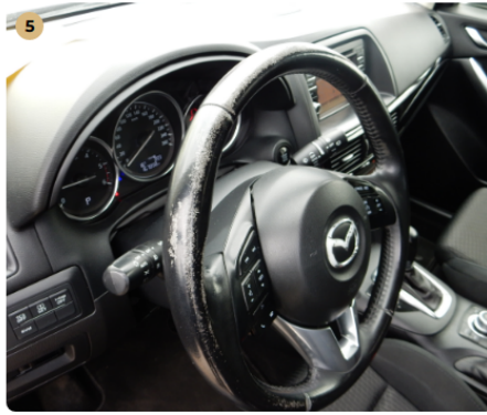
5 műszerfal Kopott kormány