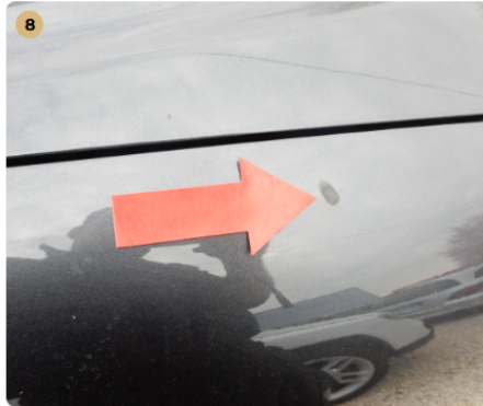
8 jobb első sárvédő Kopásnyom