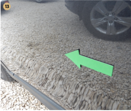
! bal első ajtó Horpadás