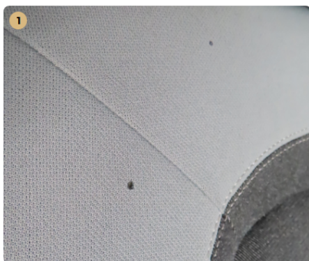
⚠ jobb hátsó üléskárpit cigaretta égetés