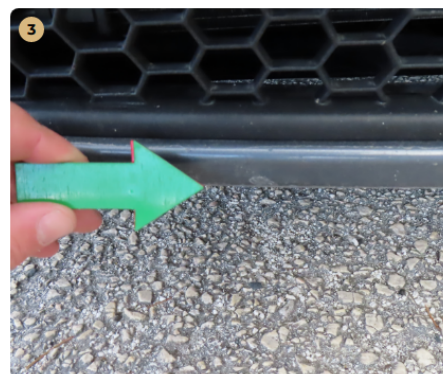
⚠ első lökhárító kavics sérült, horzsolts, fény sérült