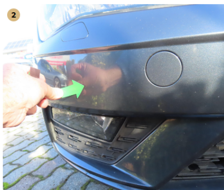
! első lökhárító