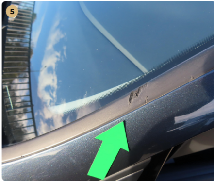
! Első szélvédő keret karc