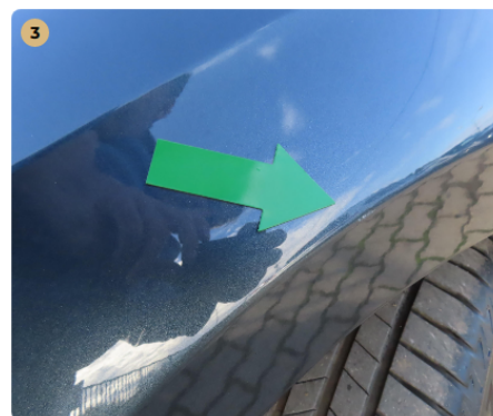
! bal első sárvédő