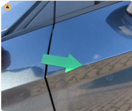
! bal első ajtó leverődés