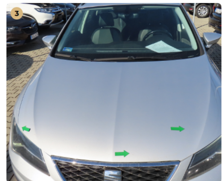
⚠ motorháztető kavics sérült