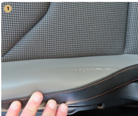
⚠ bal első üléskárpit kárpit kirepedt