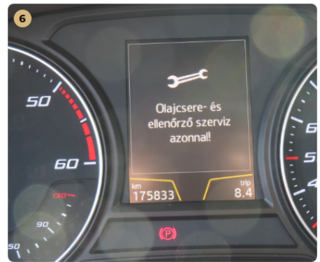
! motor szervíz esedékes