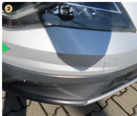
⚠ első lökhárító nagyon kavicsos