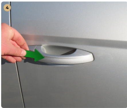
! jobb első ajtó kilincs köfelverődés