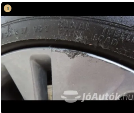
⚠ bal hátsó felni horzsolás