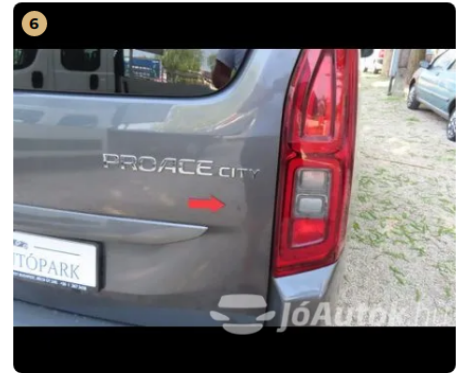
! csomagter ajtó horpadás