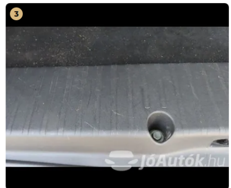
⚠ csomagtér belső műanyag burkolatok karcosak