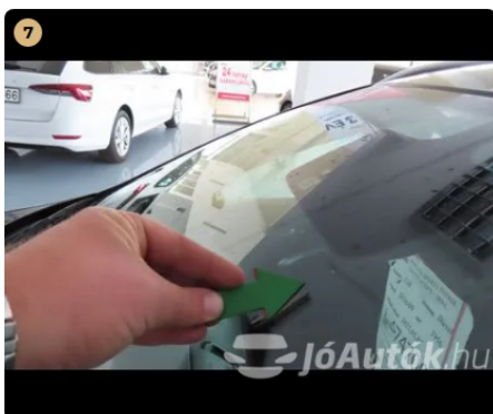
⚠ első szélvédő kavics sérülések