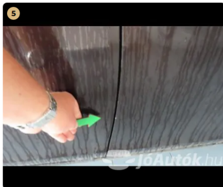
⚠ jobb első ajtó fénysérülés