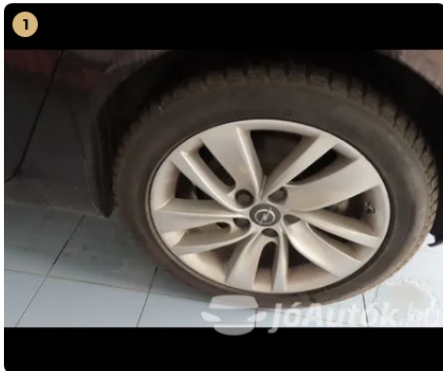
✓ alufelnik gyári állapotúak