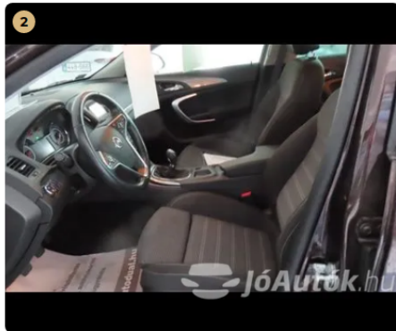
✓ belső kárpitozás újszerű