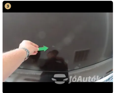
⚠ motorháztető kavics sérülések