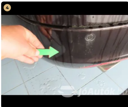
⚠ hátsó vészharító és csomagter ajtó karcok, fénysérülések