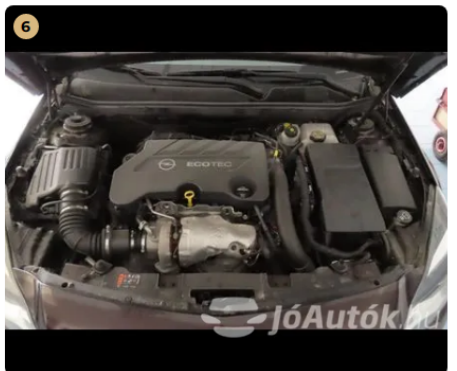
✓ motor megkímélt, szépen jár, folyadékok szintje megfelelő