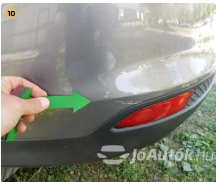
! Karc a hátsó lökhárító alján