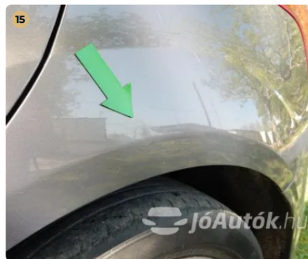
! Kisebb horpadás a bal hátsó sárvédőn