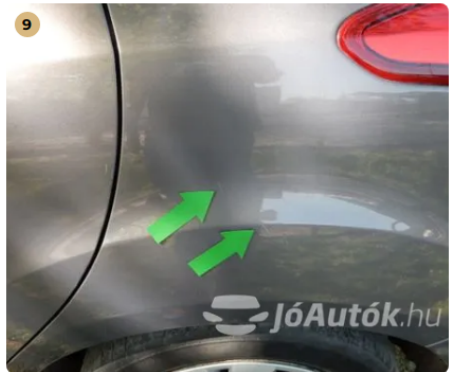
! Karc a bal hátsó sárvédőn