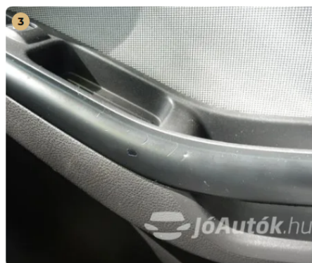
▲ Károsított felület