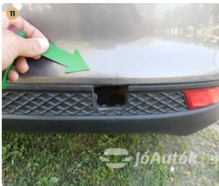
! Karc a hátsó lökhárító alján