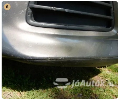
! Kisebb sérülések az első lökhárító alján