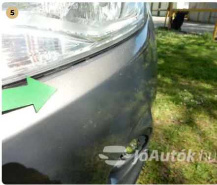
! Kavicsnyomok az első lökhárítón