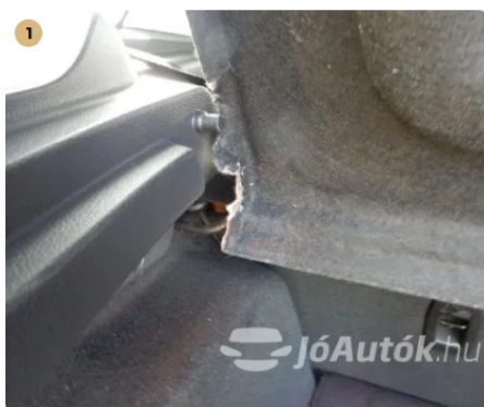
▲ Károsított felület