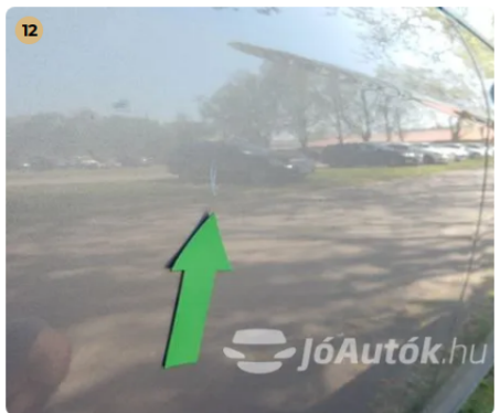
! Karc a hátsó lökhárító alján