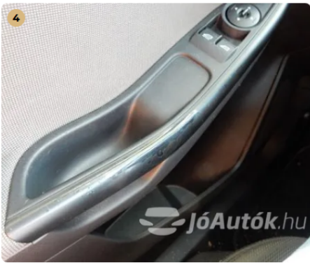
! Kopás az ajtóbehúzókon