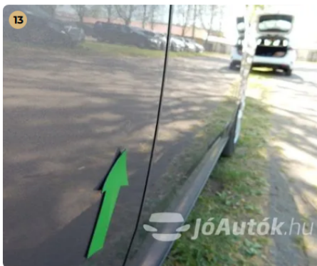
! Apró horpadás a jobb hátsó ajtón