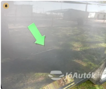
! Karc a bal hátsó ajtón