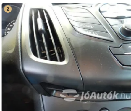
▲ Károsított felület