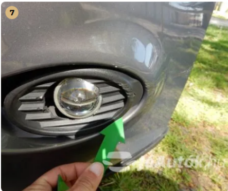
! Sérülés az első ködlámpánál