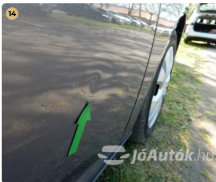
! Kisebb horpadás a jobb első ajtón