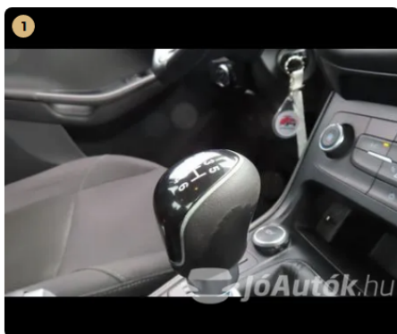
⚠ váltógomb kopott