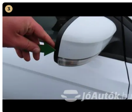
⚠ jobb első visszapillantó tükör enyhén horzsolts