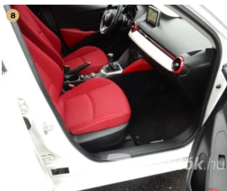
✓ Kárpitozás és belső burkolatok Egyéb -