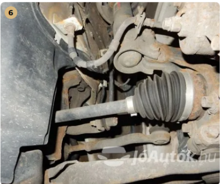
✓ Hajtás A féltengely gumiharangoknál szakadást nem észleltem. -