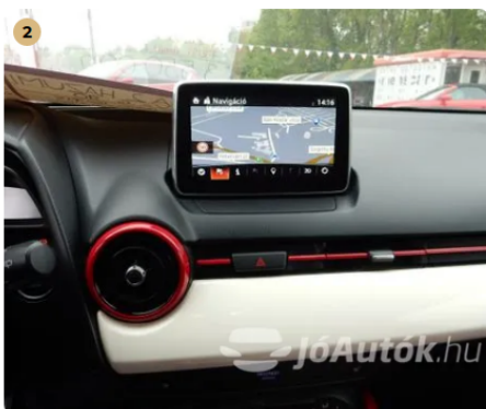
✓ Extra tartozékok és felszereltségek Egyéb -