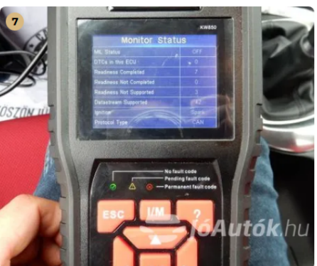
✓ Hibakód kiolvasása Számítógépes kiolvasás során nem találtam hibát. -