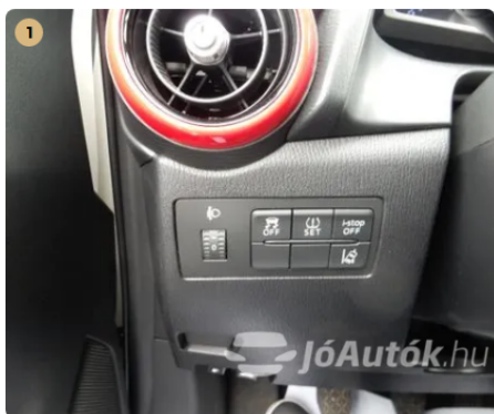
✓ Elektromos berendezések Egyéb -