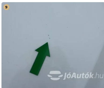
⚠ Külső karosszéria elemek Egyéb -