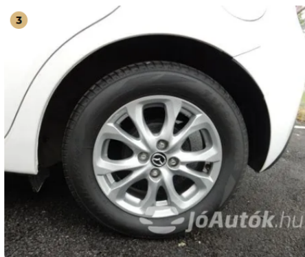
✓ Felnik Könnyűfém felni nem karcos. -