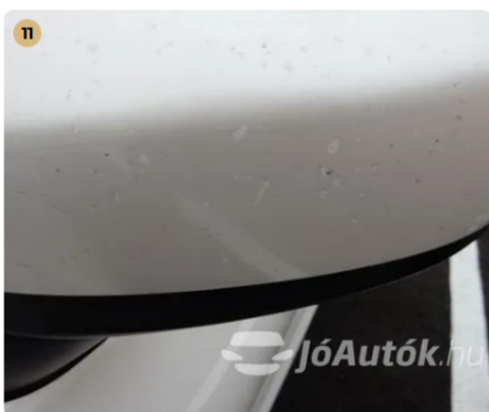
⚠ Külső karosszéria elemek Egyéb -