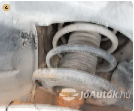
✓ Futómű A lengéscsillapítón olajfolyás nem észlelhető. -