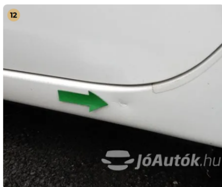
⚠ Külső karosszéria elemek Egyéb -