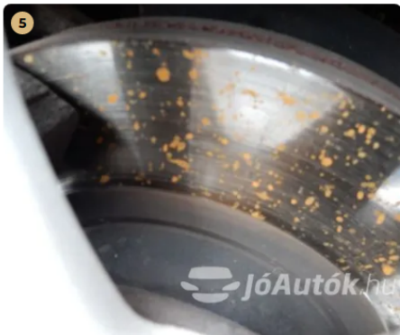
✓ Fékkrendszer A féktárcsa megfelelő állapotban van. -