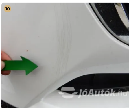
⚠ Külső karosszéria elemek Egyéb -