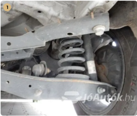
✓ Futómű megfelelő állapotban van