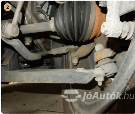
✓ Féltengelyek épek