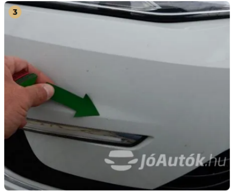
⚠ Horzsolás az első lökhárítón