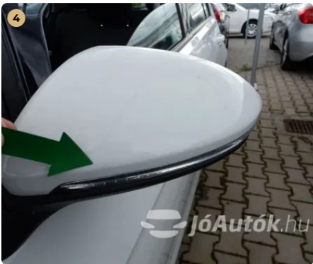
⚠ Karc a tükrön