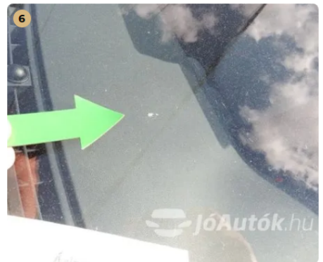
⚠ Kavicsfelverődés az első szélvédőn