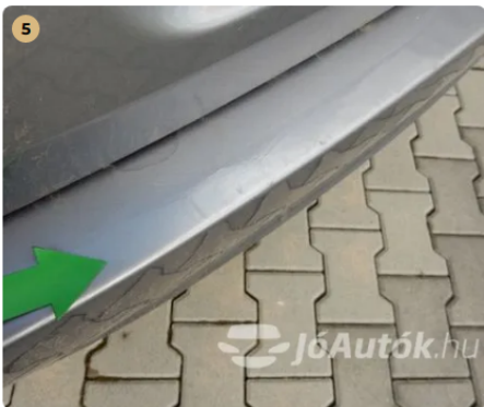
⚠ Karcok a hátsó lökhárító rakodóperemén