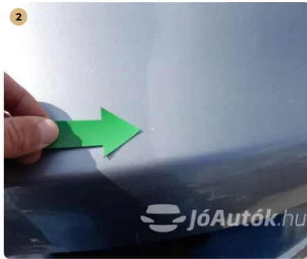
⚠ Kavicsnyom a motorháztetőn