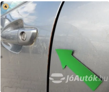
⚠ Apró sérülések a bal első ajtó peremén