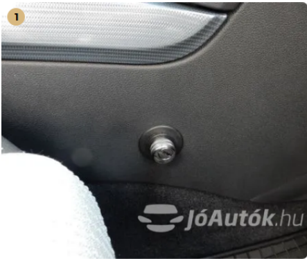
✓ Váltózárral felszerelt autó