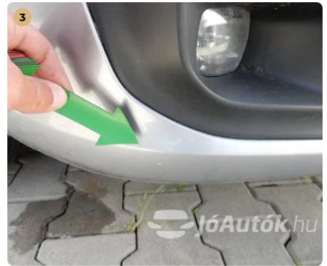
⚠ Kavicsnyom az első lökhárítón