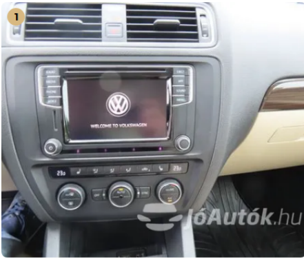
✓ Elektromos berendezések Műszerfalények megfelelően működnek. -