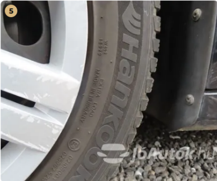
✓ Gumiabroncsok A gumi oldalfalán, szálszakadás jele (dudor) nem található. -