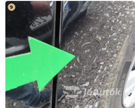
⚠ Külső karosszéria elemek Bal hátsó ajtón kis horpadás látható.