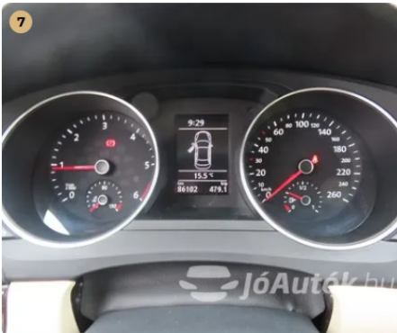
✓ Kárpitozás és belső burkolatok Műszerfal újszerű állapotú. -