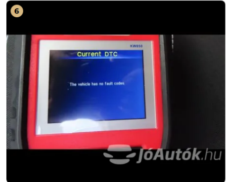
✓ Hibakód kiolvasása Számítógépes kiolvasás során nem találtam hibát. -