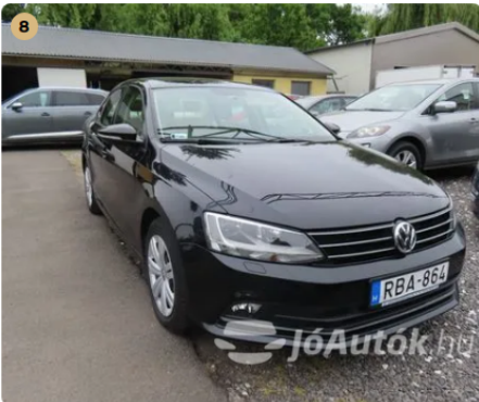
✓ Külső karosszéria elemek Műanyag lökhárítókon szemrevételezés alapján javításra utaló nyom nem látható. -