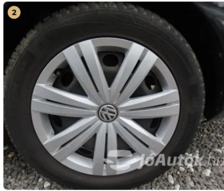
✓ Felnik Disztárcsa újszerű. -