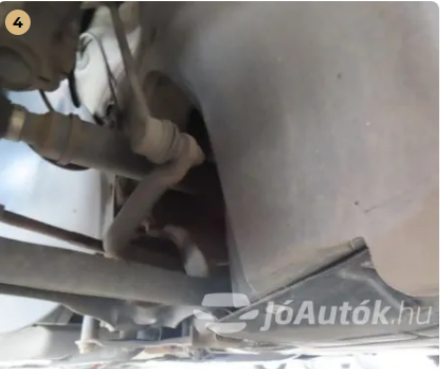
✓ Fékkrendszer A gumifékcsoveken repedés nem található. -