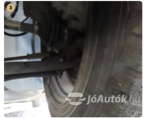
✓ Futómű A gumiharangokon szakadás, repedés nem látható. -