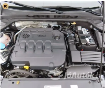
✓ Motor Motortérben olajfolyás nem látható. -