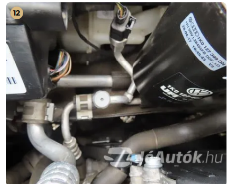
✓ Utascella és gyűrődő zónák A nyúlványokon külsérelmi nyomok nem találhatók. -