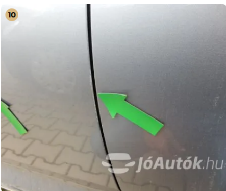
⚠ Külső karosszéria elemek