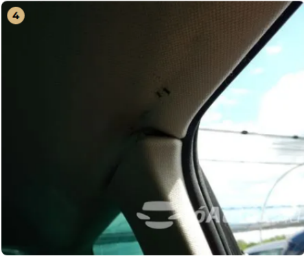
⚠ Kárpitozás és belső burkolatok