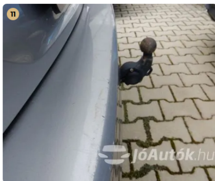
⚠ Külső karosszéria elemek