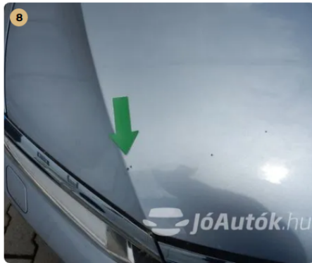
⚠ Külső karosszéria elemek