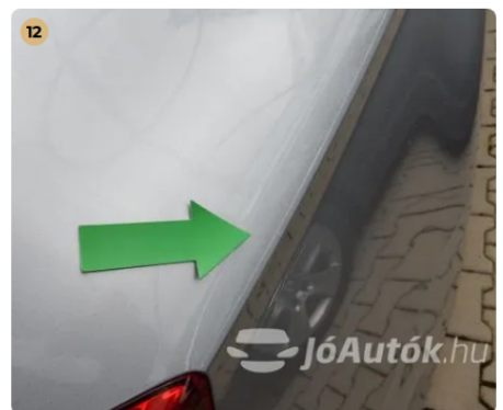
⚠ Külső karosszéria elemek