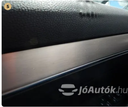
⚠ Kárpitozás és belső burkolatok