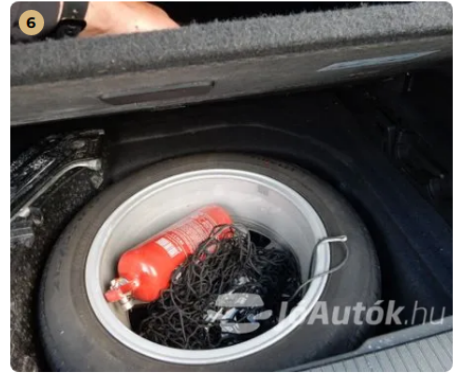
✓ Kötelező tartozékok