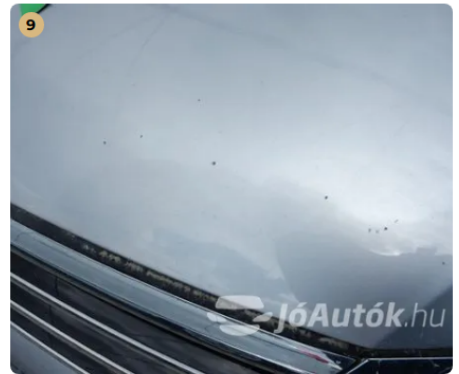
⚠ Külső karosszéria elemek