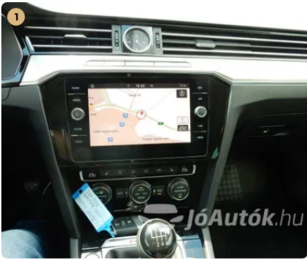
✓ Extra tartozékok és felszereltségek