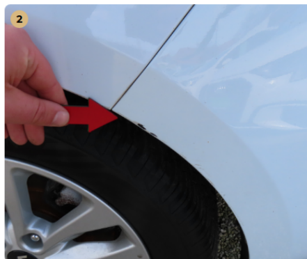
⚠ jobb első felni