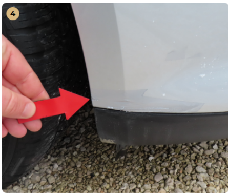
! első lökhárító horzsolt, stiftel javítva