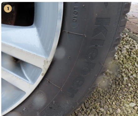
⚠ bal hátsó felni