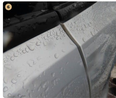
! bal hátsó ajtó eláll