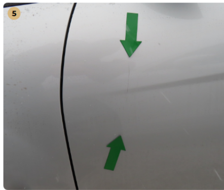
! bal első ajtó karc , fény sérülés