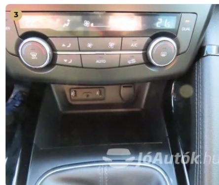
3 Két zónás digit klíma