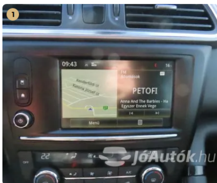
1 Led kijelző