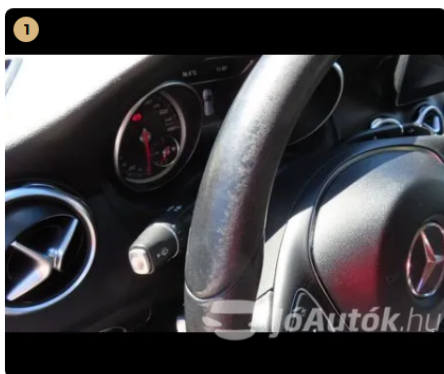
⚠️ kormány kopott