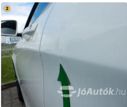
⚠ Horpadás a bal hátsó ajtón