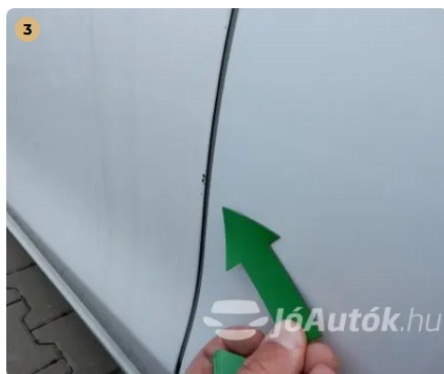
⚠ Kopás a bal hátsó ajtó peremén