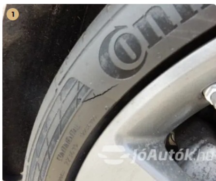
⚠ Repedés az egyik gumi oldalfalán