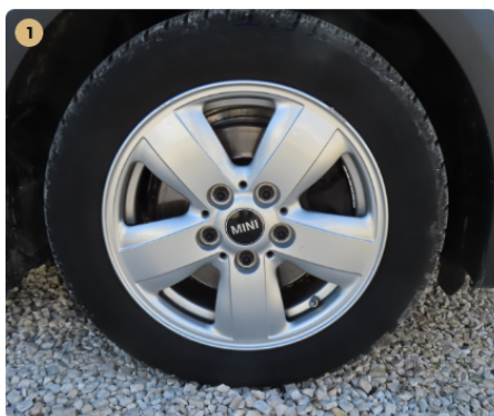
1 bal első felni felnik horzsoltak