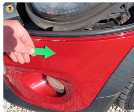
3 első lökhárító horzsolt, fénysérült