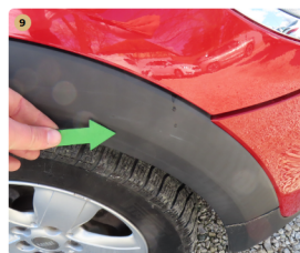
9 jobb első sárvédő díszléc horzsolás