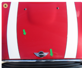
4 motorháztető kavics sérülések