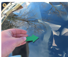
11 első szélvédő kavics sérülések