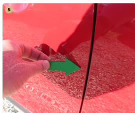
5 bal első ajtó fény sérülés