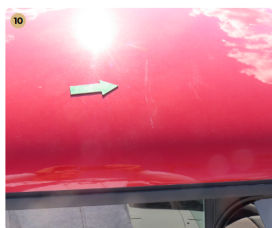
10 tető karcos