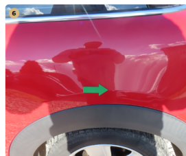
6 bal hátsó sárvédő karc, fény sérülés