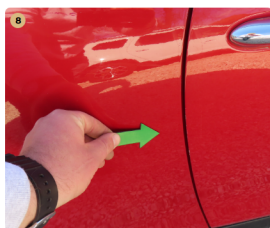
8 jobb első ajtó fény sérülés