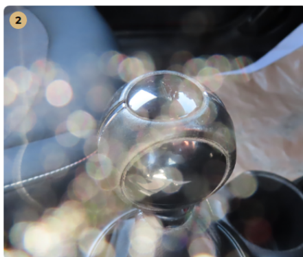
2 műszerfal váltógomb kopott, kormány karcos,