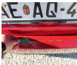
7 hátsó lökhárító karcos