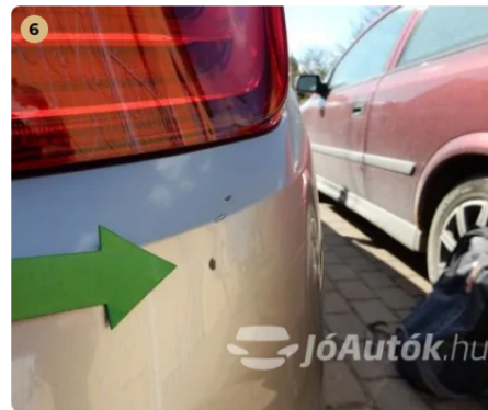
! Hátsó lökhárítón kisebb horzsolás Hátsó lökhárítón kisebb horzsolás