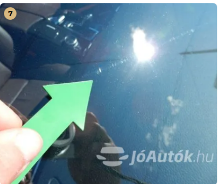
! Kisebb kavicsnyomok a szélvédőn Kisebb kavicsnyomok a szélvédőn, repedve törve nincs.