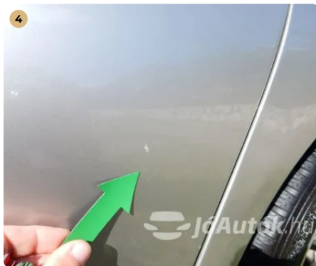
! Kisebb horzsolás a bal hátsó ajtón Rányításból eredő horzsolás, polírozható