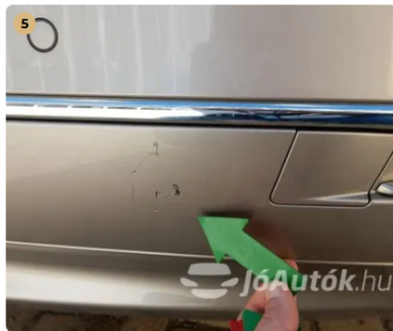
! Hátsó lökhárítón karcolás Hátsó lökhárítón kisebb karcolás