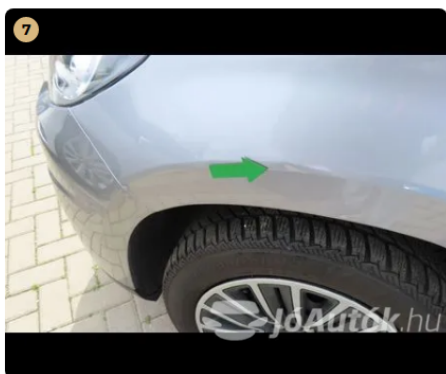
! bal első sárvédő horpadás