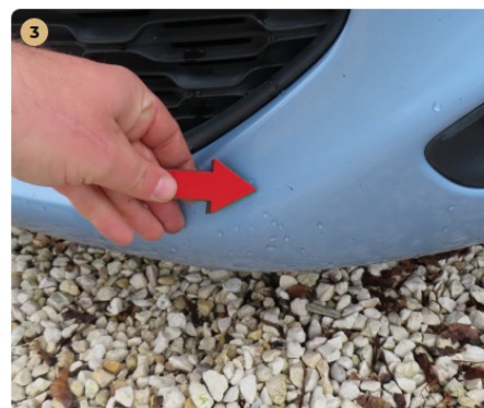
⚠ első lökhárító

hátsó gumi abroncsok repedezettek, régiek