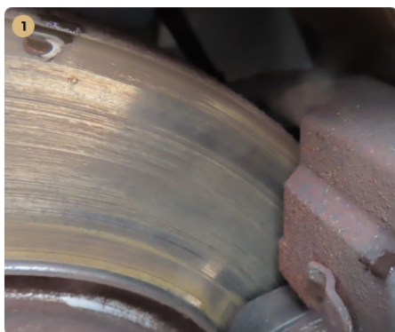
⚠ bal első féktárcsa