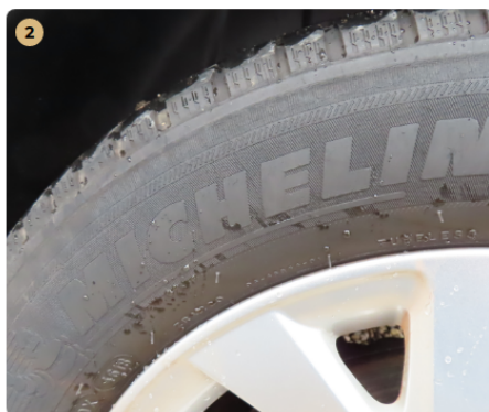
⚠ bal hátsó gumi

hátsó gumi abroncsok repedezettek, régiek