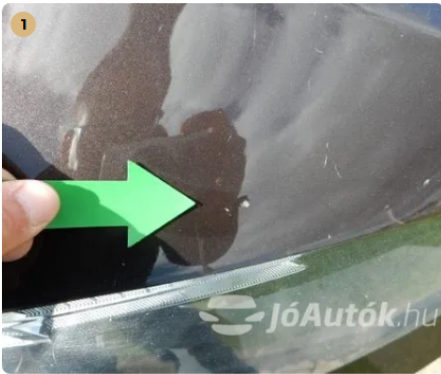
⚠ Kavicsnyomok a motorháztetőn