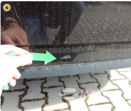
⚠ Festék lepattogás a hátsó lökhárítón