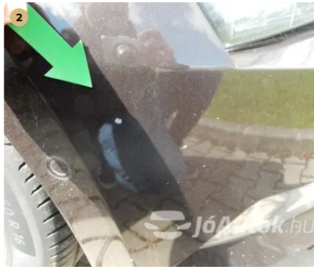
⚠ Kavicsnyomok az első lökhárítón