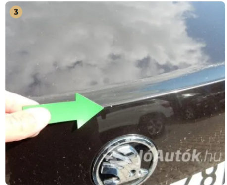
⚠ Csomagtér élén apró sérülés