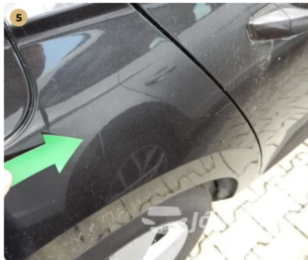
⚠ Karc a jobb hátsó sárvédőn