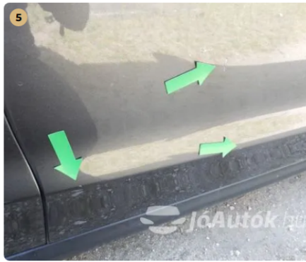
⚠ Kisebb fényezés sérülések a jobb első ajtón