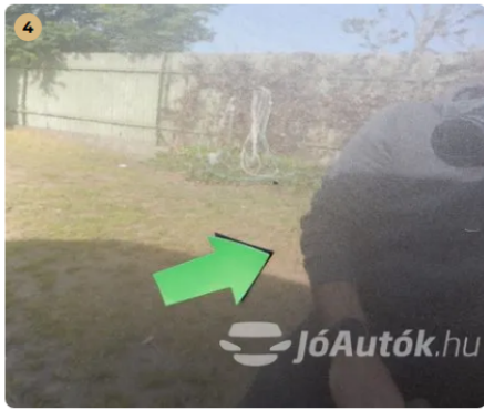
⚠ Karc a jobb hátsó ajtón